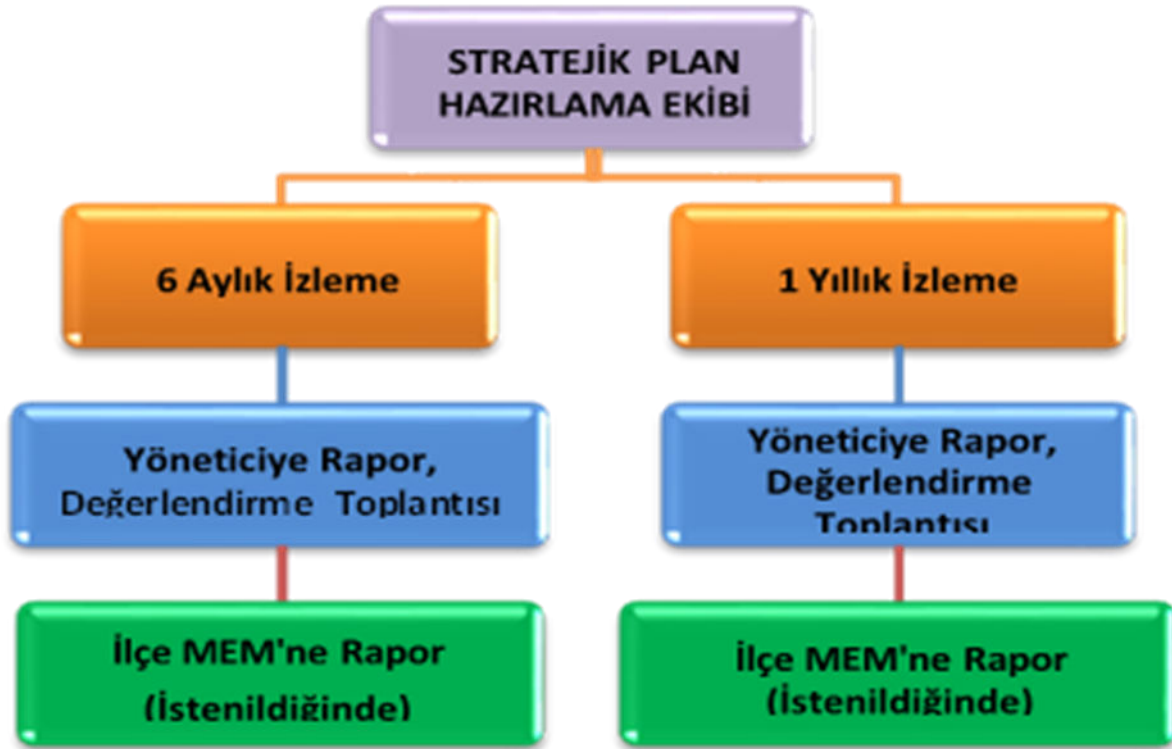
Şekil 3: İzleme ve Değerlendirme Süreci

Müdürlüğümüzün 2024-2028 Stratejik Planı İzleme ve Değerlendirme sürecini ifade eden İzleme ve Değerlendirme Modeli hazırlanmıştır. Müdürlüğümüzün Stratejik Plan İzleme- Değerlendirme çalışmaları eğitim-öğretim yılı çalışma takvimi de dikkate alınarak 6 aylık ve 1 yıllık sürelerde gerçekleştirilecektir. 6 aylık sürelerde rapor hazırlanacak ve değerlendirme toplantısı düzenlenecektir. İzleme-değerlendirme raporu, istenildiğinde İlçe Milli Eğitim Müdürlüğü'ne gönderilecektir. Ayrıca ilçemizin Mülki İdari Amirine sunulacaktır. 1 yıllık izleme-değerlendirme çalışmaları, Stratejik Planımızda yer alan hedeflerin yıllık düzeyde ifade edildiği Performans Programı ve yıl sonunda gerçekleşme düzeylerinin belirlendiği Faaliyet Raporu hazırlanarak yapılacaktır.